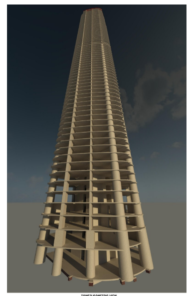
300 George Street Tower, Brisbane, 2021